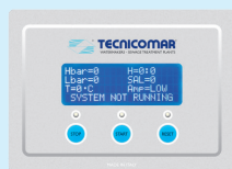
Controllo a distanza CDMAR-3