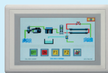
Controllo a distanza con display LCD touch-screen da 7"