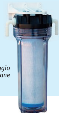
Filtro per il flusso automatico membrane