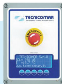
Centralina di controllo a microprocessore